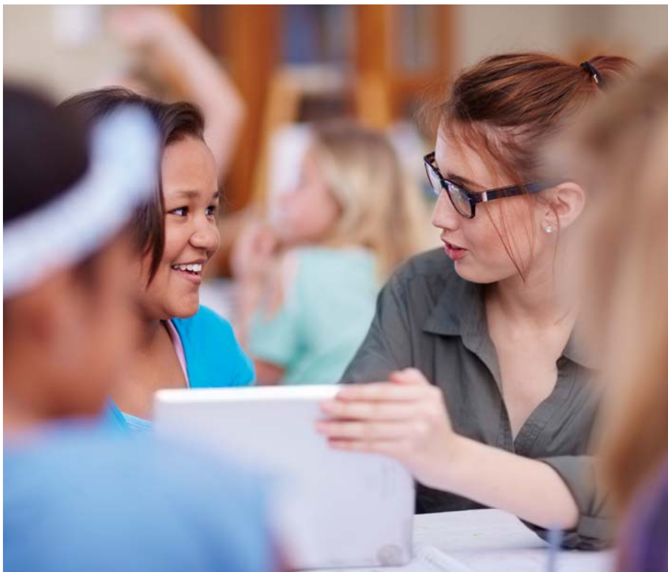
Die Daten werden alle vier Jahre bei Schüler*innen im Alter zwischen elf und 17 Jahren österreichweit erhoben. Dabei stellen sich Schulen ab der 5. Schulstufe freiwillig zur Verfügung, in denen Schüler*innen aus ein oder zwei Klassen der 5., 7., 9. oder 11. Schulstufe während einer Schulstunde einen Online-Fragebogen ausfüllen.

anthropometrische Merkmale (u.a. Gewicht, Größe) und Blutdruck messen und Blut-, Urin- und Speichelproben abnehmen (National Center for Social Research, 2023). Die Ergänzung von Messdaten lässt somit eine genauere Erfassung von Risikofaktoren zu, wodurch die Möglichkeit geschaffen wird, Präventionsmaßnahmen zielgerichteter umzusetzen.