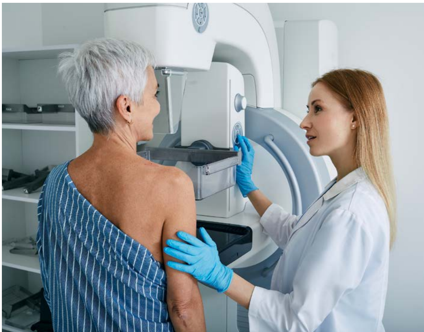
Auch im Bereich der Diagnose, etwa bei der Erkennung und Klassifikation von Krebs durch körperliche Untersuchungen, Laboruntersuchungen und bildgebende Verfahren, gewinnen E-Health-Anwendungen zunehmend an Bedeutung.

Die neueste Entwicklung sind auf künstlicher Intelligenz (KI) basierende, teledermatologische Apps für das Smartphone für den kommerziellen Gebrauch, bei welchen das aufgenommene Bild nicht durch Dermatolog*innen sondern durch einen Algorithmus befundet wird. Aufgrund der bisher schlechten Diagnosequalität sind diese Apps bisher nicht geeignet, Vorsorgeuntersuchungen durch Dermatolog*innen zu ersetzen (Freeman et al. 2020).